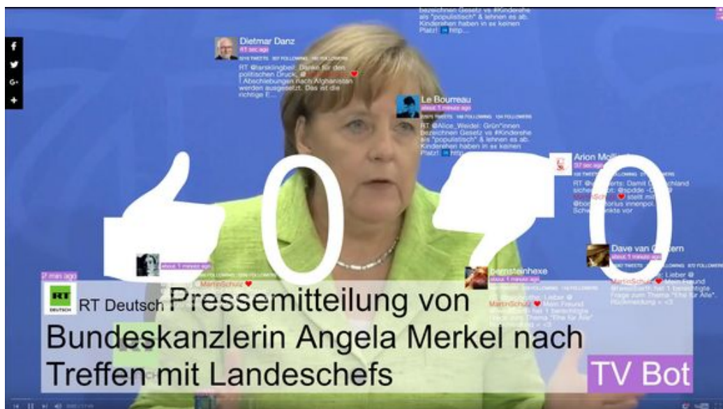
Bundestagswahl - Meinungskampf in den Sozialen Medien , Screenshot, marclee.io/tvbot/?p=35 © Marc Lee

We will continue presenting the individual exhibitions. This week we are going to introduce No Image Is an Island which will be on display at Port25 - Raum für Gegenwartskunst. We've asked Marc Lee a question about his work for this exhibition.