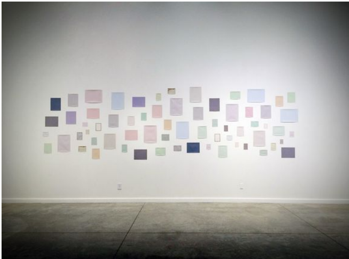
F&D Cartier, Wait and See (Installation aus historischen Fotopapieren, unfixiert, Transformer Station, Cleveland, OH), 2016, variable Größe, Collection of Fred and Laura Ruth Bidwell © F&D Cartier / F&D Cartier, Wait and See (Installation of Vintage Photo Papers, unfixiert, Transformer Station, Cleveland, OH), 2016, variable dimensions, Collection of Fred and Laura Ruth Bidwell © F&D Cartier

In the upcoming newsletters we will present the individual exhibitions of the Biennale 2017 alongside a Q & A with the participating artists.